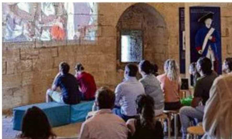
Les élèves ont montré leur production aux parents, jeudi 22 juin.